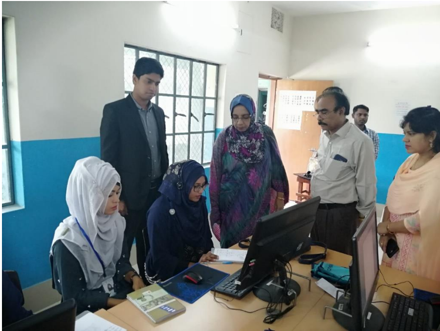
চিত্র: প্রশিক্ষার্থীদের প্রশিক্ষণ কার্যক্রম পরিদর্শন