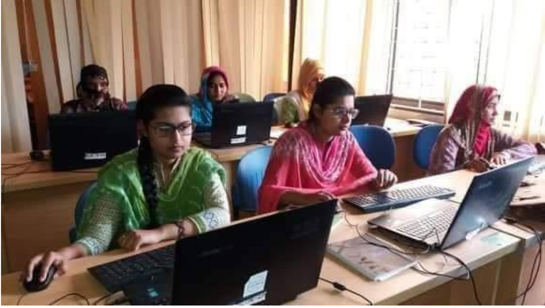
চিত্র: প্রশিক্ষার্থীদের প্রশিক্ষণ প্রদান করা হচ্ছে