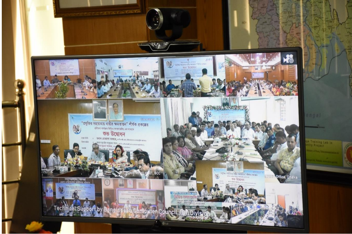
চিত্র: প্রযুক্তির সহায়তায় নারীর ক্ষমতায়ন প্রকল্পের উদ্বোধনী অনুষ্ঠান

প্রকল্পের প্রশিক্ষণ মডিউল মোট ৩টি ক্যাটাগরিতে বিভক্ত; ১। Freelancer to Entrepreneur ২। IT Service Provider ৩। Women Call Centre Agent । এই তিন ক্যাটাগরিতে দেশের ২১টি বৃহত্তর জেলায় Freelancer to Entrepreneur এ ৪০০০ জন, IT Service Provider এ ৪০০০ জন, Women Call Centre Agent এ ২৫০০ জনসহ মোট ১০৫০০ জন নারীকে প্রশিক্ষণ ও ইন্টার্নশীপ প্রদান করা হয়েছে। তিন লেভেলের ৮ মাস ১২ দিন ব্যাপী এ প্রশিক্ষণ ও ইন্টার্নশীপ গত ৩০ জুন, ২০১৯ তারিখে সম্পন্ন হয়েছে। তিনটি লেভেলের ১ম লেভেলে ৩ মাস প্রশিক্ষণ ও ২ মাস ইন্টার্নশীপ, ২য় লেভেলে ১ মাস প্রশিক্ষণ ২ মাস ইন্টার্নশীপ এবং ৩য় লেভেলে ১২ দিনের ফলোআপ প্রশিক্ষণ অনুষ্ঠিত হয়েছে। এ প্রকল্পের একটি উল্লেখযোগ্য উপাদান হচ্ছে প্রশিক্ষণের পাশাপাশি হাতে কলমে শিক্ষা বা ইন্টার্নশীপ ১ম ও ২য় লেভেল প্রশিক্ষণ সমাপ্ত করার পরে প্রশিক্ষণার্থীগণের জেলা পর্যায়ে বিভিন্ন আইটি প্রতিষ্ঠানে ২ মাস করে ইন্টার্নশীপ সম্পন্ন করেছে।