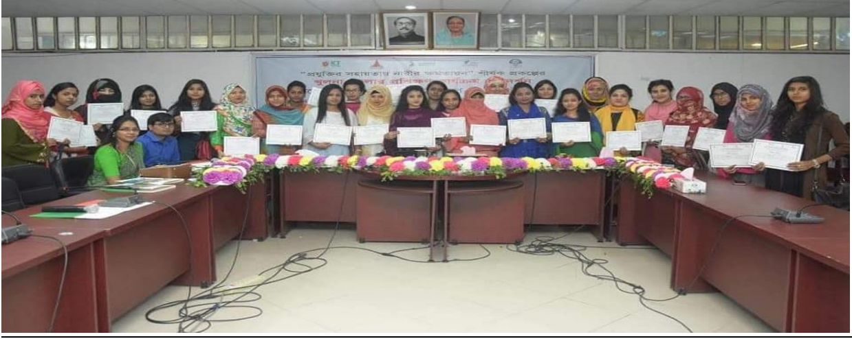
চিত্র: প্রশিক্ষার্থীদের মাঝে সনদপত্র বিতরণ

সফলভাবে প্রশিক্ষণ সম্পন্নকারী অনেক প্রশিক্ষার্থী এখন সাবলম্বী হয়েছে। কেউ কেউ উদ্যোক্তা হিসেবে গড়ে উঠেছে। আবার অনেকের বিভিন্ন প্রতিষ্ঠানে কর্মসংস্থান হয়েছে। সর্বোপরি, নারী-পুরুষের বৈষম্যমুক্ত বাংলাদেশ বিনির্মাণে, আওয়ামীলীগ সরকারের নির্বাচনী ইশতেহারে আমার গ্রাম-আমার শহর, তারুণ্যের শক্তি-বাংলাদেশের সমৃদ্ধি এবং নারীর ক্ষমতায়ন এই তিনটি গুরুত্বপূর্ণ ইশতেহার বাস্তবায়নে এ প্রকল্পটি গুরুত্বপূর্ণ অনুষ্ণ হিসেবে কাজ করছে।