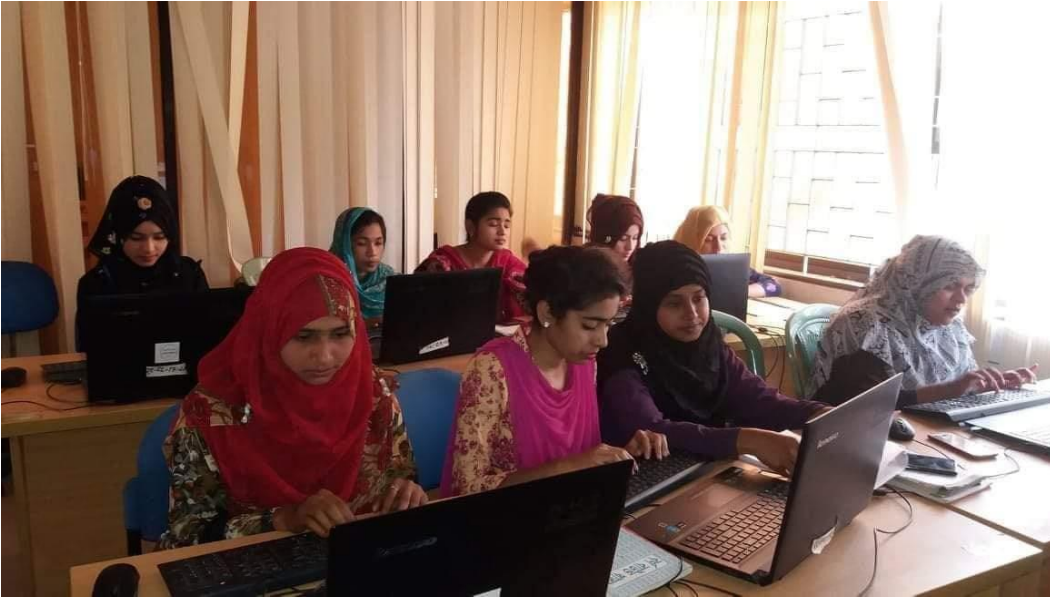
চিত্র: প্রশিক্ষণ চলাকালীন প্রশিক্ষণার্থীগণ